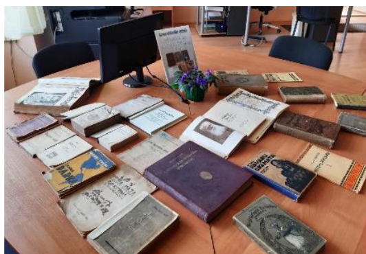
Izstāde “Grāmatas no vecvecmāmiņas laikiem...” Annas bibliotēkā 2023. gada aprīlī

Annas bibliotēkā , tuvojoties latviešu grāmatas piecsimtgadei, tika organizēts pasākums “Grāmata – būtne ar savu vēsturi, nozīmi, uzdevumu, smaržu, likteni un īpašnieku”, kurā par senajām grāmatām Alūksnes novada bibliotēkā varēja uzzināt ikviens apmeklētājs, sarunās noskaidrots, kādas senās grāmatas atrodas pagasta iedzīvotāju mājās un no tām bibliotēkā veidota izstāde “Grāmatas no vecvecmāmiņas laikiem...”. Iedzīvotāji paši nesa tās uz bibliotēku un veidoja stāstu, kāpēc tās viņiem ir īpašas un joprojām tiek saglabātas.