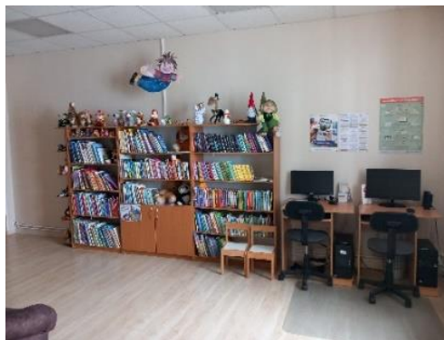
Malienas bibliotēkas telpas 1. stāvā