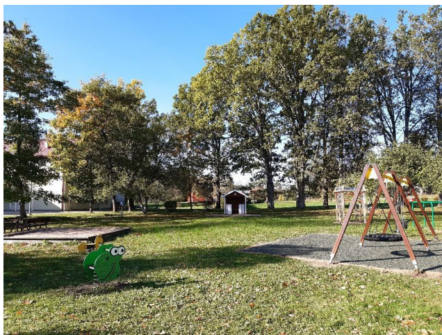
Pateicoties novadnieka Daumanta Vika ziedojumam, labiekārtots laukums pie Annas bibliotēkas

Alūksnes novada bibliotēkas struktūrvienība “Annas bibliotēka” pārskata periodā bibliotēka saņēmusi ziedojumu no novadnieka Daumanta Vika 40 000 USD (37029 EUR), kura rezultātā varēja iegādāties preces, lai piesaistītu apmeklētājus un paplašinātu pakalpojumu klāstu, kā arī labiekārtotu bibliotēkas apkārtni - iegādātas āra spēles – EUR 609, aprīkojums (šūpoles, rotaļu elementi, soli u.c.) laukuma un teritorijas labiekārtošanai - EUR 10790. 2024. gadā plānots iegādāties interaktīvas lietas, izmantošanai bibliotēkas telpās, lai piesaistītu pusaudžus un jauniešus apmeklēt bibliotēku (virtuālās realitātes brilles u.c.).