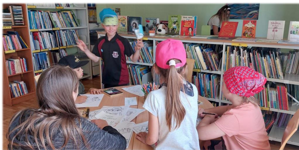
Pirāti Alūksnes novada bibliotēkā

Lai iepazītos ar Alūksnes novada bibliotēku un bērnu apkalpošanas nodaļu, tematisko stundu “Bibliotēka un grāmata” apmeklēja PII iestādes Sprīdītis jaunākās grupas bērni. Jaunā mācību gada sākumā bibliotēku trīs apmeklēja 2. klases (50 apmeklētāji). Skolēni iepazīnās ar bibliotēkas lietošanas noteikumiem, mācījās atrast grāmatas krājumā un pildīja citus radošus uzdevumus.