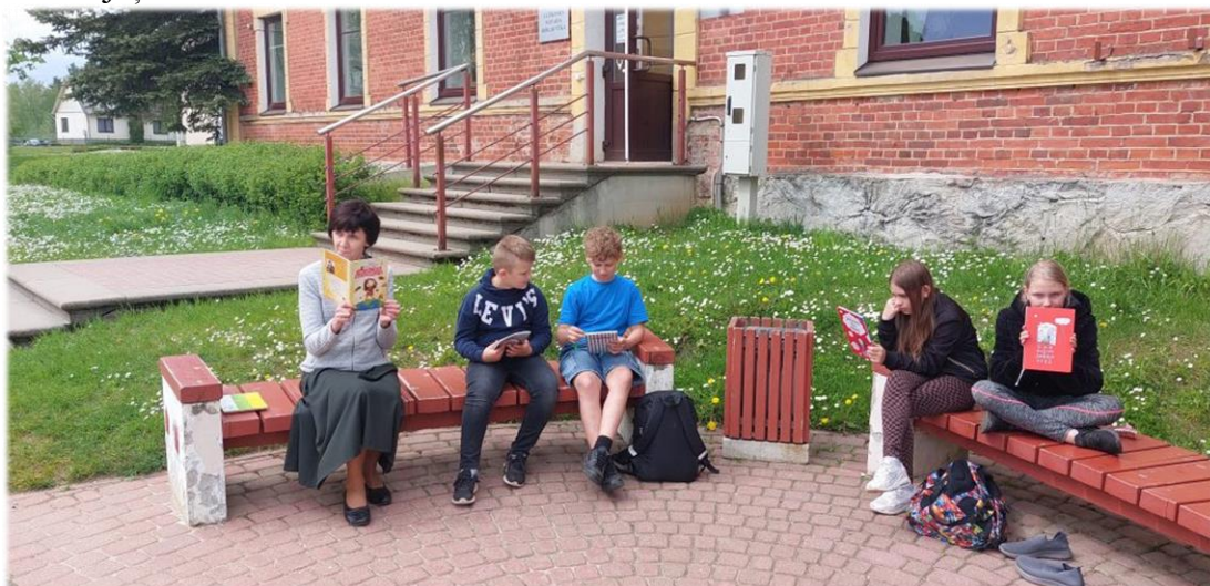
Lasīšanas zibakcija pie Alūksnes novada bibliotēkas

Alūksnes novada bibliotēkas Bērnu apkalpošanas nodaļas darbinieces aicināja apmeklētājus piedalīties Maijas Laukmanes jubilejai veltītajā zibakcijā pie bibliotēkas, kurā skaļi lasījām dzejnieces dzejoļus.