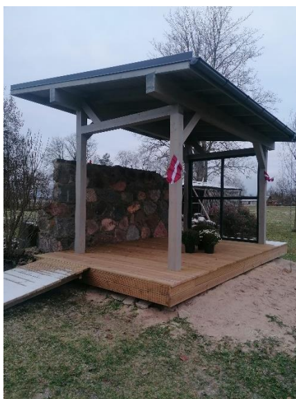
Āra lasītava – terase pie Mārupes bibliotēkas tapusi projektā “Iedvesmas bibliotēka 2023”

Īstenojot projektu “Iedvesmas bibliotēka 2023”, pateicoties Latvijas Nacionālās bibliotēkas Atbalsta biedrības un Alūksnes novada pašvaldības finansējumam, pie Alūksnes novada bibliotēkas struktūrvienības “Mārupes bibliotēka” uzcelta āra terase – lasītava, radot iedzīvotāju brīvā laika pavadīšanai labvēlīgu un funkcionālu vidi visa vecuma grupu iedzīvotājiem, jo īpaši domājot par bērnu un jauniešu brīvā laika pavadīšanas iespējām. Āra lasītavas atklāšana plānota 2024. gada pavasarī.