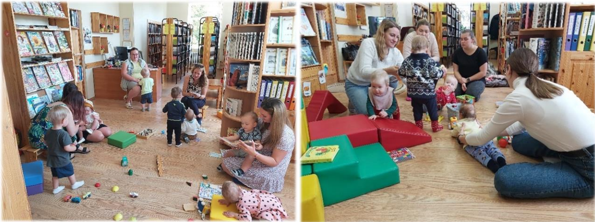
Mazuļu rīti Jaunalūksnes bibliotēkā

Aprīlī Jaunalūksnes bibliotēkā notika nodarbība PII “Pūcīte” mazākās grupiņas bērniem (bērnu vecums 2,5 līdz 3 gadi) “Pavasaris laukā un bibliotēkā”. Iepazinām bibliotēku, apskatījām lielāko un mazāko bibliotēkas grāmatu. Nodarbības noslēgumā katrs bērniņš “atrada” paslēptus pavasara simbolus, uzdevums veicināja pirkstu veiclību, radošumu, prasmi noturēt uzmanību.