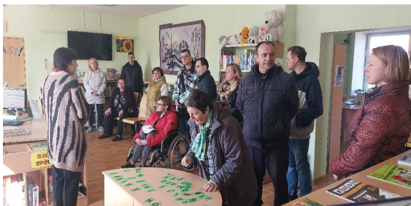
Dienas aprūpes centra “Saules stars” klienti regulāri iepazīstas ar jaunumiem Alūksnes novada bibliotēkā

Alūksnes novada bibliotēkā viesojas Alūksnes Sociālās lietu pārvaldes dienas aprūpes centra “Saules stars” klienti ar sociālajiem darbiniekiem, lai iepazītos ar bibliotēkas pakalpojumiem un piedalītos īpaši viņiem sagatavotās aktivitātēs.