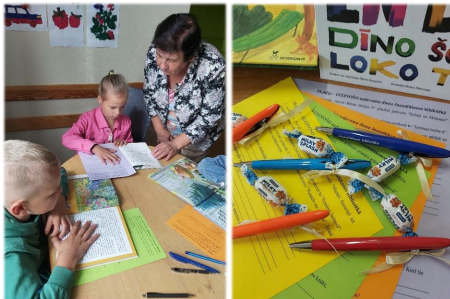
Nodarbība Jaunalūksnes bibliotēkā