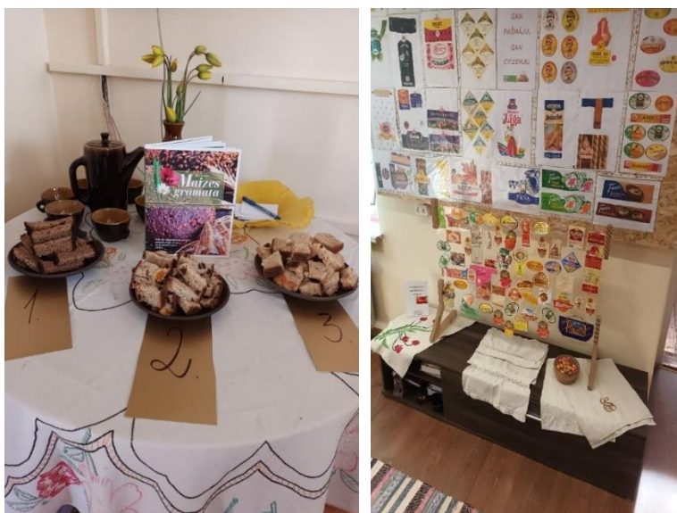
Maizes etiķešu izstāde un degustācija Mārkalnes Vēstures istabā

Pededzes bibliotēkā organizēts pasākums “Vēstures mirkļu pieturā”, kurā izskatīja albumus, dalījās atmiņās un papildināja vēstures materiālu atpazīstamību.