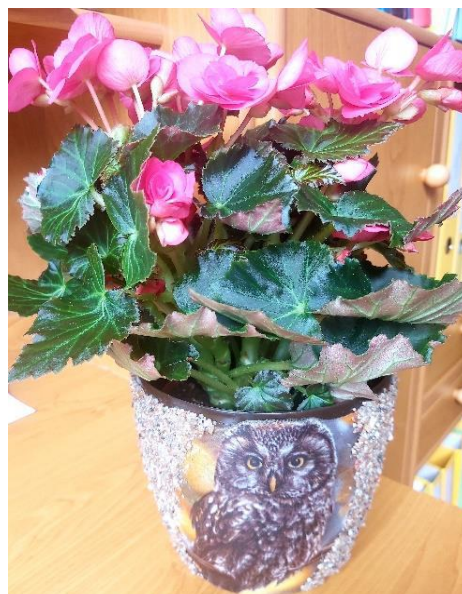
Lasītāja pateicība Liepnas bibliotēkas vadītājai