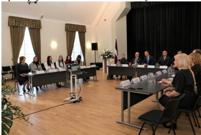
Tikšanās ar Latvijas Valsts prezidentu Egilu Levitu 03.05.2023. Alūksnes Kultūras centrā