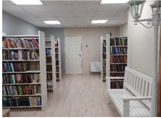
Malienas bibliotēkas telpas 2. stāvā

Struktūrvienības “Jaunannas bibliotēka” telpas paplašinātas, atsevišķā telpā iekārtojot Valsts un pašvaldības vienoto klientu apkalpošanas centru (8m 2 ), tajās apmeklētājiem pieejama darba vieta, kas aprīkota ar datoru.