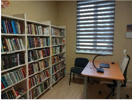
VPVKAC Malienas bibliotēkā