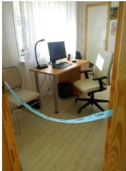
VPVKAC Jaunannas bibliotēkā tā atklāšanas dienā 01.03.2023.

Struktūrvienības “Jaunannas bibliotēka” telpas paplašinātas, atsevišķā telpā iekārtojot Valsts un pašvaldības vienoto klientu apkalpošanas centru (8m 2 ), tajās apmeklētājiem pieejama darba vieta, kas aprīkota ar datoru.