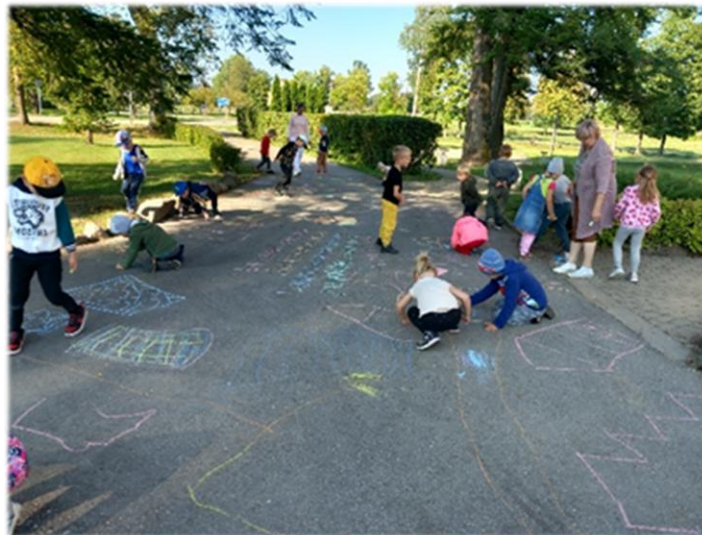
Dzeja elpo Malienā

Malienas pamatskolas vecuma bērni piedalījās pasākumā “Kad vecais satiekas ar jauno”. Bibliotēkā bija izvietota seno grāmatu izstāde, kas veltīta “Latviešu grāmatai 500”. Pēc izstādes apskates bērni izvēlējās Raiņa grāmatu “Zelta sietiņš”, lasīja dzejoļus - pēc pašu izvēles. “Ja es būtu mākslinieks”- kādu veidotu grāmatas noformējumu. Tapa grāmatas vāka noformējums. Ar PII “Mazputniņš” bērniem piedalījāmies dzejas dienu pasākuma “Dzeja elpo”, izmantojām I. Zanderes dzejoļu krājumu Dieguburti, attiecīgi tapa zīmējumi uz asfalta.