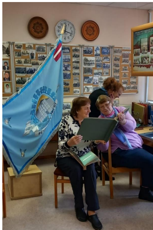
Pie Pededzes bibliotēkas iekārtota likvidētās skolas vēstures istaba “Vēstures mirkļu pietura”

Alsviķu bibliotēkas pakalpojumu sniegšanas vietā Strautiņos blakus bibliotēkas telpām pagastu apvienības pārvalde piešķirusi telpu, kurā tiek izkārtoti no likvidētās skolas saņemtie materiāli par skolas vēsturi un novadnieku Jāni Gresti.