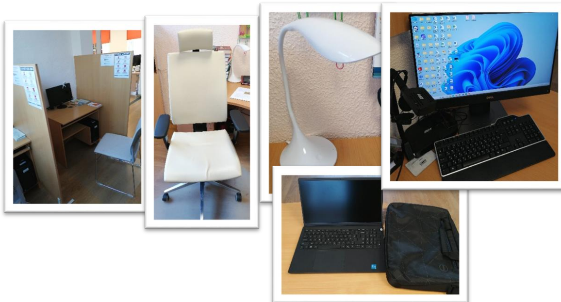
VPKAC aprīkojums Jaunlaicenes bibliotēkā

Pārskata periodā kopumā Alūksnes novada bibliotēkā un tās 16 struktūrvienībās lietotājiem pieejamas 63 datortehnikas vienības, darbinieku rīcībā ir 34 datori. 28% no visas bibliotēkās esošās datortehnikas iegādāti pēdējos 2 gados un tas ir pateicoties valsts budžeta dotācijai un pašvaldības finansējumam VPKAC izveidei un to darbības nodrošināšanai bibliotēkās.