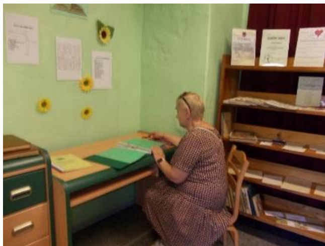
Izstāde Zeltiņu vēstures krātuvē “Ceļš grāmatai uz ļaudīm darināts”