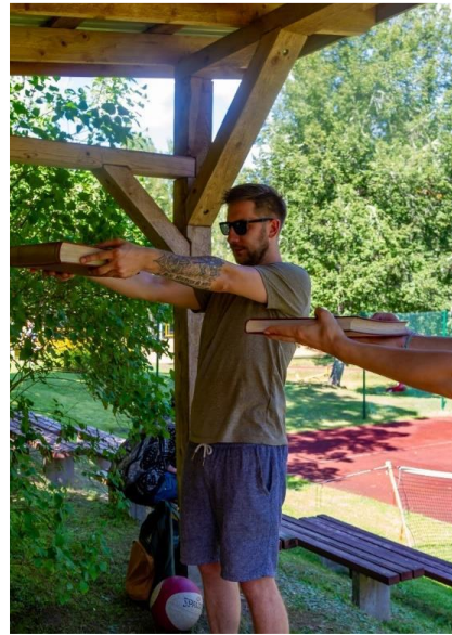
Atzīmējot Zeltiņu bibliotēkas jubileju, pat Pagasta sporta svētku aktivitātēs galvenā tēma - par un ap grāmatām. Stacijā “Balts krekls” un “A-Ž”