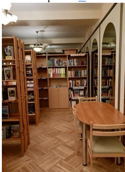
Māriņkalna bibliotēka tagad iekārtota tautas nama ēkā

Arī Alūksnes novada bibliotēkas struktūrvienībai “Malienas bibliotēka”, pateicoties strukturālajām izmaiņām pašvaldībā un pagasta pārvalžu reorganizācijai, bija iespēja daļēji pārcelties uz citām telpām ēkas 1.stāvā (79m 2 ). Tagad, lai arī bibliotēka izvietota 2 stāvos, bibliotēkas telpas ir ērti pieejamas ikvienam apmeklētājam. 1. stāvā izvietota lasītāju apkalpošanas zona, zona bērniem, interneta pieejas punkts, Valsts un pašvaldības vienotais klientu apkalpošanas centrs, izvietots vairāk pieprasītās daiļliteratūras krājums. 2. stāvā izvietota retāk pieprasītā daiļliteratūra un nozaru literatūra.