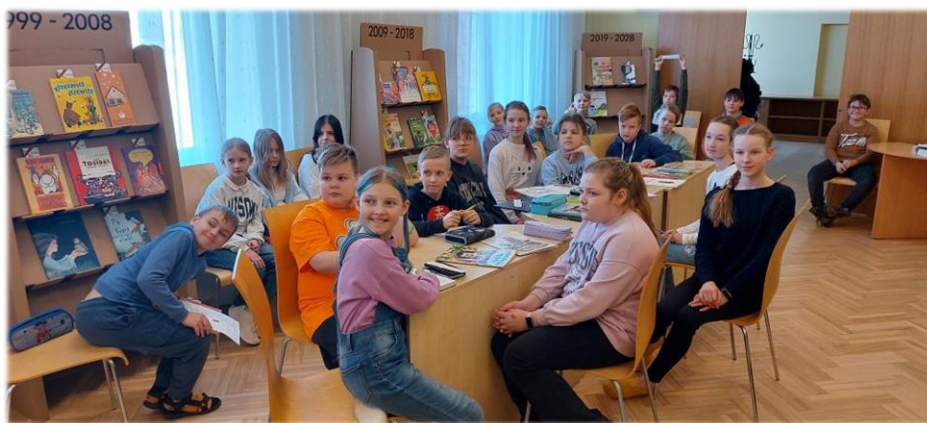
Rīgas Centrālās bibliotēkas ceļojošā grāmatu izstāde “100+ grāmatas bērniem” Alūksnē

Alūksnes novada bibliotēkas Bērnu apkalpošanas nodaļas darbinieces aicināja apmeklētājus piedalīties Maijas Laukmanes jubilejai veltītajā zibakcijā pie bibliotēkas, kurā skaļi lasījām dzejnieces dzejoļus.