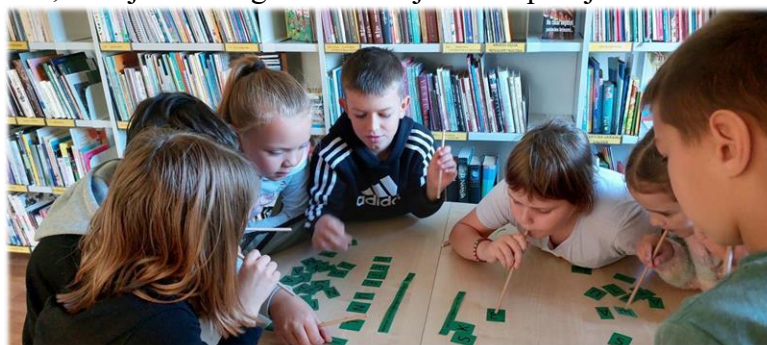
Tematiskā stunda “Bibliotēka un grāmata”

Lai iepazītos ar Alūksnes novada bibliotēku un bērnu apkalpošanas nodaļu, tematisko stundu “Bibliotēka un grāmata” apmeklēja PII iestādes Sprīdītis jaunākās grupas bērni. Jaunā mācību gada sākumā bibliotēku trīs apmeklēja 2. klases (50 apmeklētāji). Skolēni iepazīnās ar bibliotēkas lietošanas noteikumiem, mācījās atrast grāmatas krājumā un pildīja citus radošus uzdevumus.