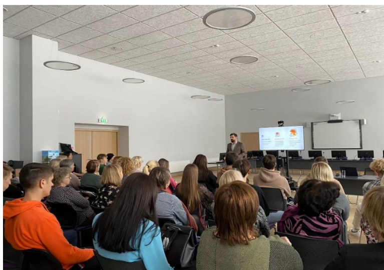
Par Alūksnes novada bibliotēkas ar centra Europe Direct Gulbene finansiālo atbalstu organizēto lekciju “Kas ir mākslīgais intelekts un kā to izmantot?” bija liela interese