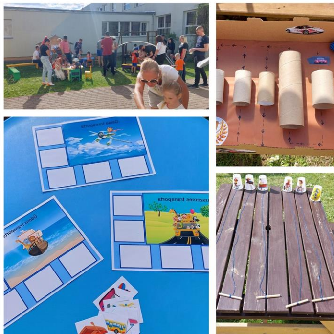
Alūksnes novada bibliotēkas dalība novada ģimeņu sporta dienā

Pēc piedalīšanās SIA “TET” seminārā par medijpratību pirmskolas vecuma bērniem, tika organizēta stunda pirmskolas vecuma bērniem par drošu internetu. Nodarbībā tika izmantotas filmiņas no TET skoliņas par Ričiju Rū, uzdevumi- rēbusi un sameklē vārdus.