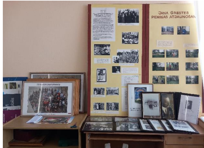
Slēgtās Strautiņu skolas vēstures materiāli tagad izvietoti atsevišķā telpā Alsviķu bibliotēkas pakalpojumu sniegšanas vietā Strautiņos.

Atbildības un pienākumi par vēstures istabām / krātuvēm ir noteiktas bibliotēku darbinieku amata aprakstos, daļā no vēstures krātuvēm (Bejā, Veclaicēnē, Zeltiņos) ir veikta daļēja vienību uzskaitē, bet skolu vēstures istabās pārsvarā – nē.