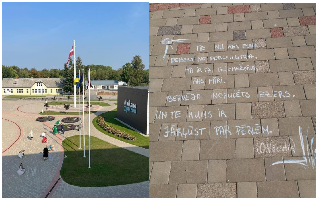
Dzejas dienu zib akcijā iesaistījās arī Alūksnes novada pašvaldības darbinieki.

13. septembrī 13 dzejoļus centrālās administrācijas laukuma bruģim uzticēja 13 pašvaldības darbinieki, kam dzeja ir tuva sirdij!