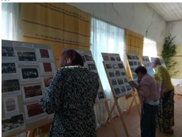
Izstāde “Ilzenes pamatskola fotogrāfijās”