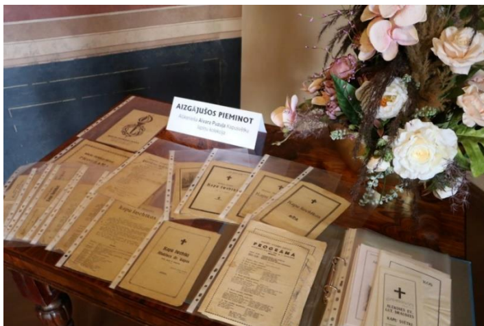
Aivara Puzuļa kolekcija “Kapusvētku lapiņas”