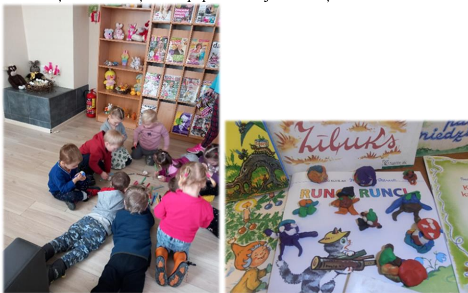
Bērniem no PII “Mazputniņš” patīk viesoties un darboties Malienas bibliotēkā

Malienas pamatskolas 7. klases skolēni apmeklēja bibliotēku, lai uzzinātu kādus pakalpojumus sniedz valsts un pašvaldības vienotais klientu apkalpošanas centrs, kurš tagad darbojas Malienas bibliotēkā, kā arī, protams, iepazīnās ar bibliotēkas piedāvātajiem pakalpojumiem, datu bāzēm, uzzināja par 3td e-grāmatu bibliotēku. Bibliotēkā regulāri notiek dažādas radošās darbnīcas, aizrautīgai un jaunu prasmju iegūšanai: Lieldienas dekoru veidošana, pēc M. Stārastes stāsta “Zīļuks” veidojām plastilīna zīļukus. Māmiņām no papīra veidojām taureņus.