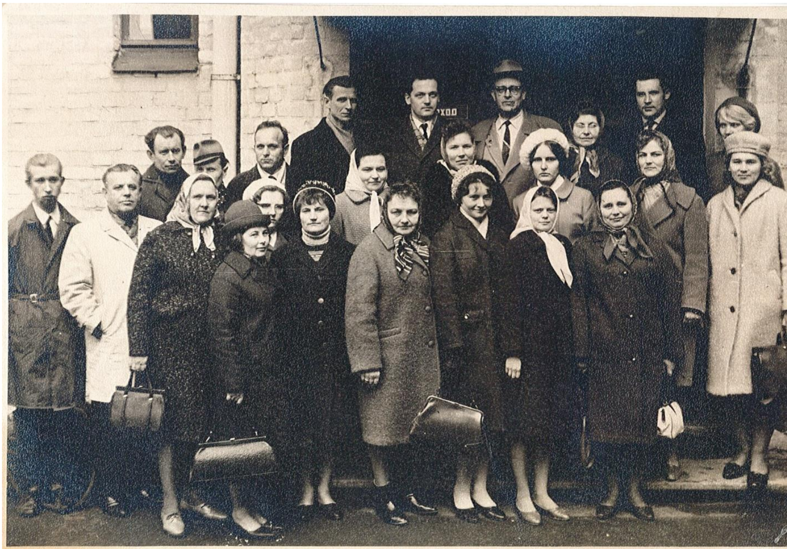
TU juridiskās fakultātes klausītāji ekskursijā Rīgā pie kriminālmilicijas morga durvīm