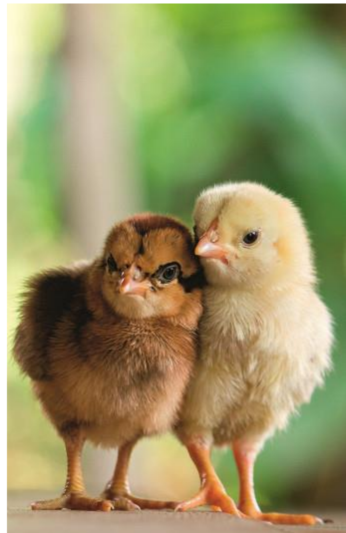
Padomju Alūksne, 23.03.1961

Al realizētu republikāniskajā putnkopju sanāksmē izvirzītos uzdevumus, tālāk attīstītu un nostiprinātu putnkopību, Alūksnes rajonā nodibināta starpkolhozu putnu fabrika, kas atrodas kolhoza «Vienība» teritorijā. Uzņēmuma celtniecība uzticēta starpkolhozu celtniecības organizācijai. Jau šopavasār paredzēts uzbūvēt vismaz divas putnu mītnes 6000 vistām. Fabrikai paplašinoties un nostiprinoties, vistu skaits palielināsies līdz 40 tūkstošiem.