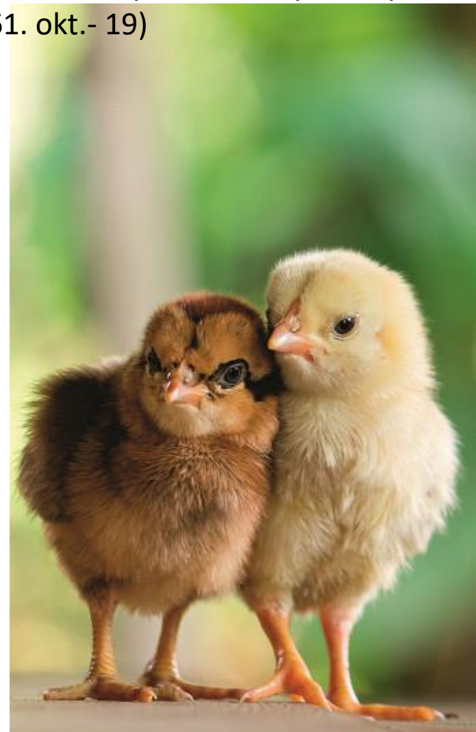
Padomju Jaunatne. 17.02.1961

1960. gadā Latvijā noorganizētas 12 specializētas putnkopības padomju saimniecības (1961. okt.- 19)