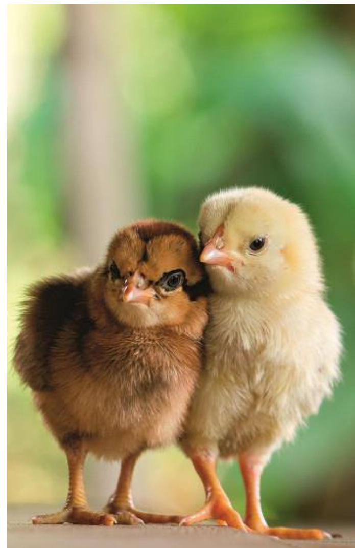
Padomju Alūksne, 7.10.1961

© līdz 17. oktobrim uzsākt aukstsprieguma līnijas un transformatora punkta izbūvi starpkolhozu putnu fermai un šim nolūkam vajadzīgos stabus sagatavot pašu spēkiem.