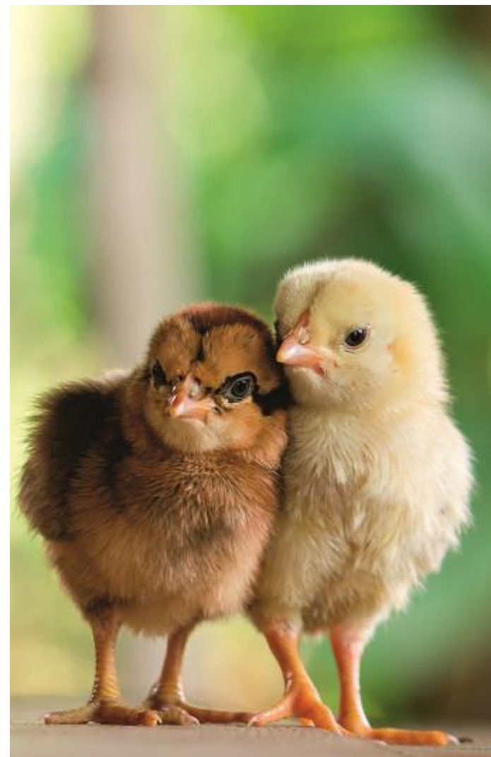
Oktoobra Karogs, 24.04. 1971

Sogad fabrikai jāražo 3 miljoni 752 tūkstoši olu. Tā ir mūsu galvenā produkcija. Salīdziniet šo skaitli ar uzņēmuma pirmajiem soļiem! Pir-