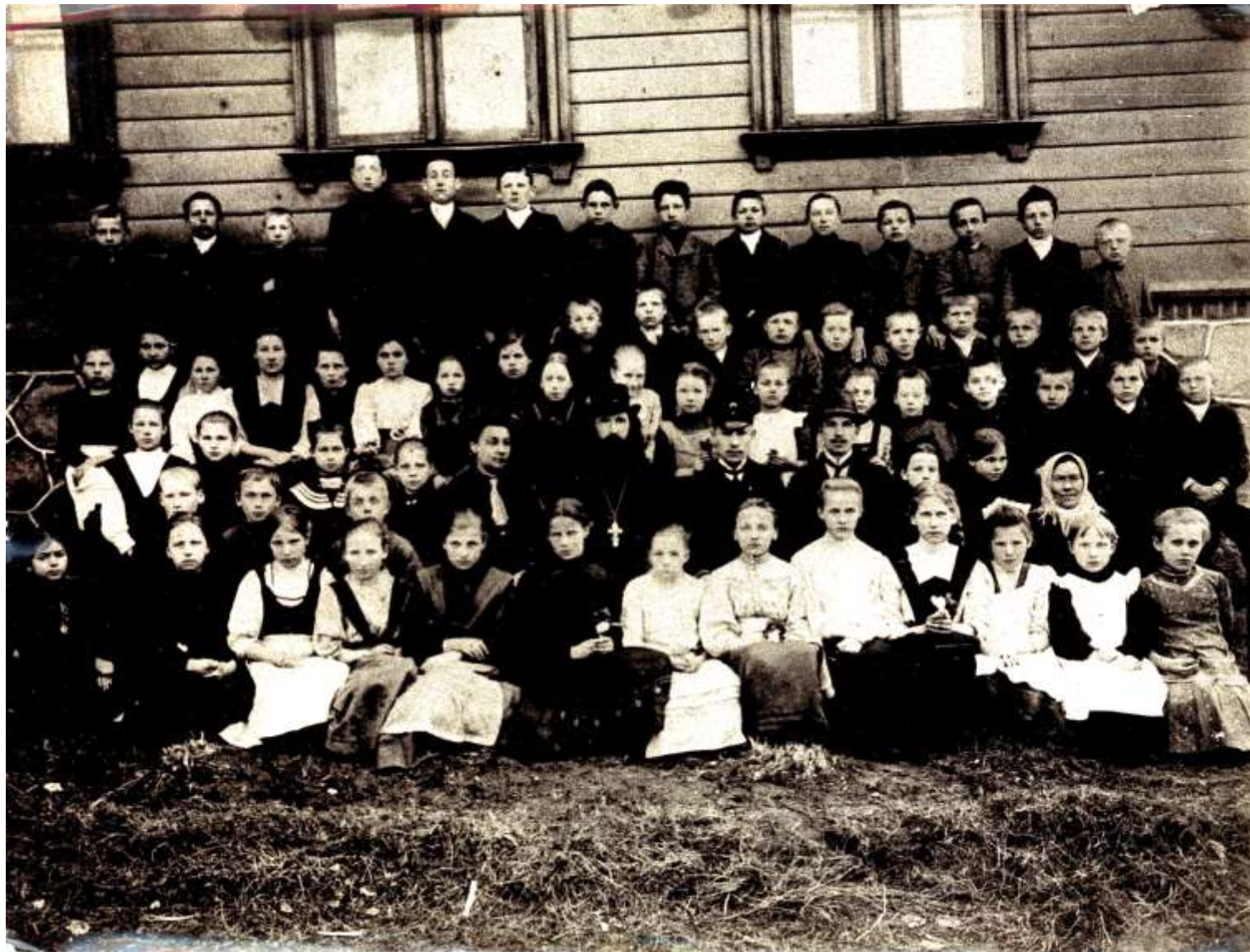
Pie draudzes skolas Tirgotāju ielā 14, foto ap 20.gs.sāk.