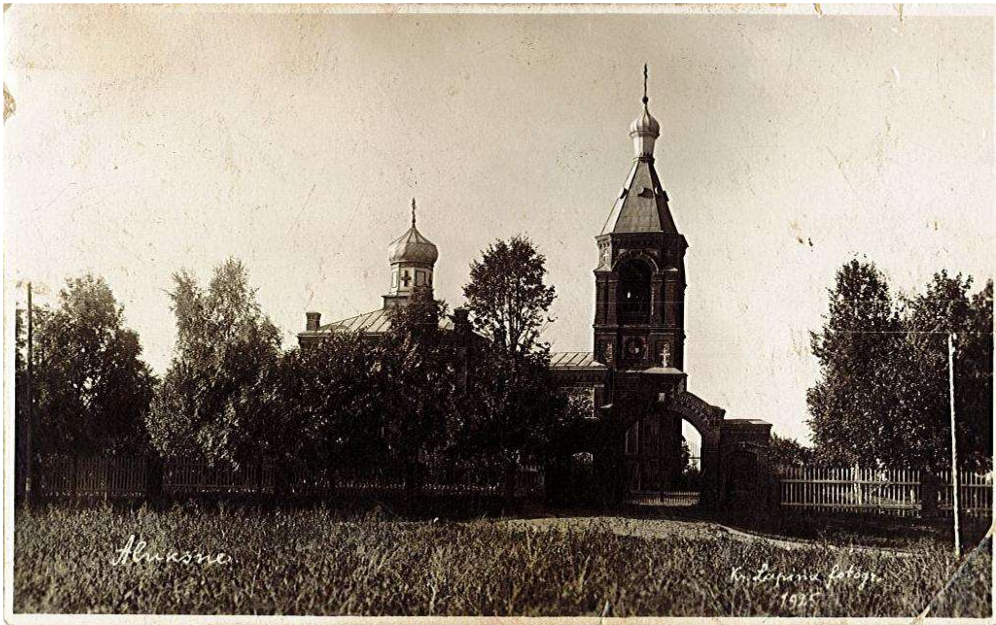
Svētās Trijādības pareizticīgo baznīca celta 1895.gadā, tad pat arī pareizticīgo draudzes skola