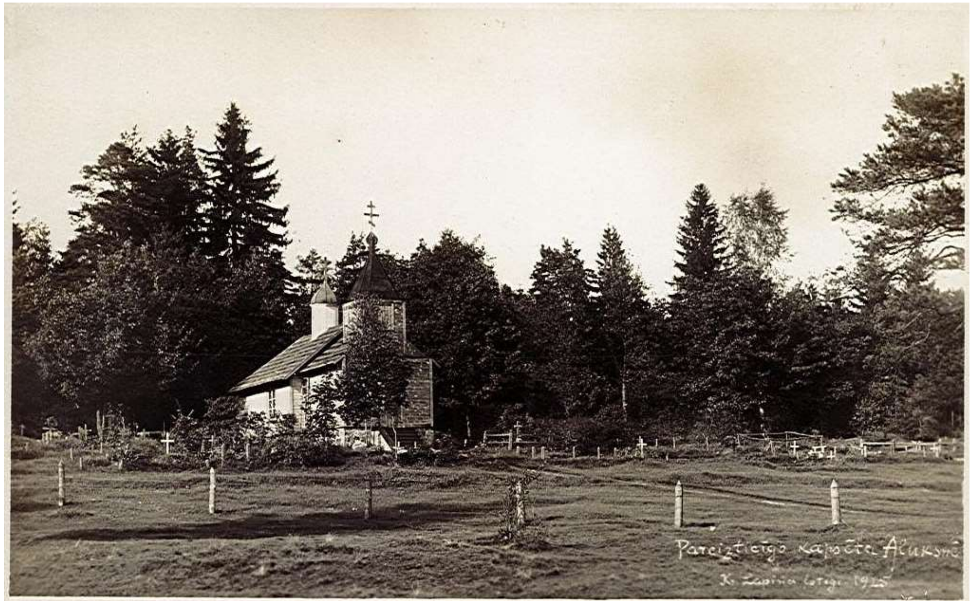
Pirmā baznīca tika aizvesta uz Alūksnes Mazajiem kapiem, bet 1925. gadā tā nodega