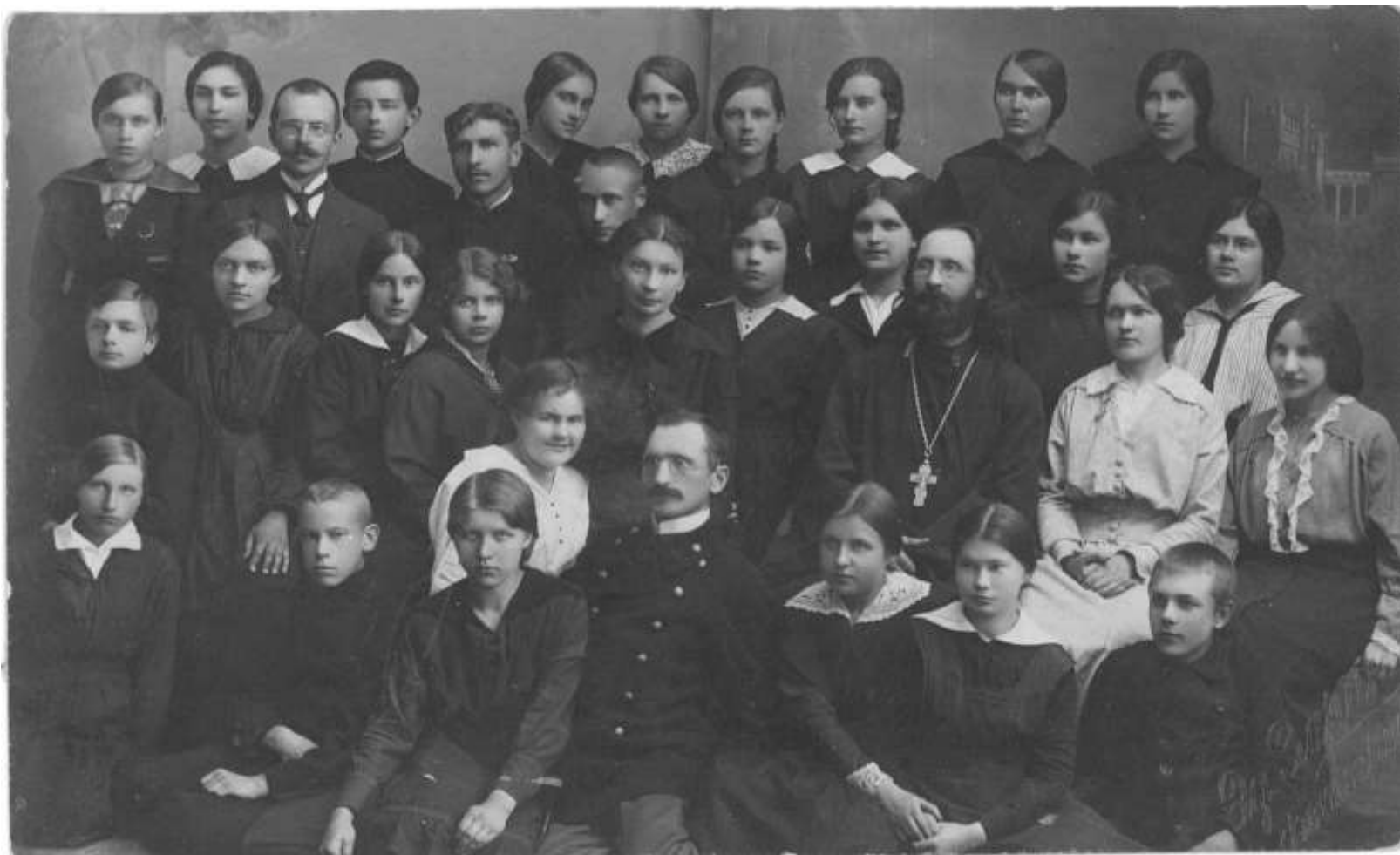
Ar progimnāzijas audzēkņiem