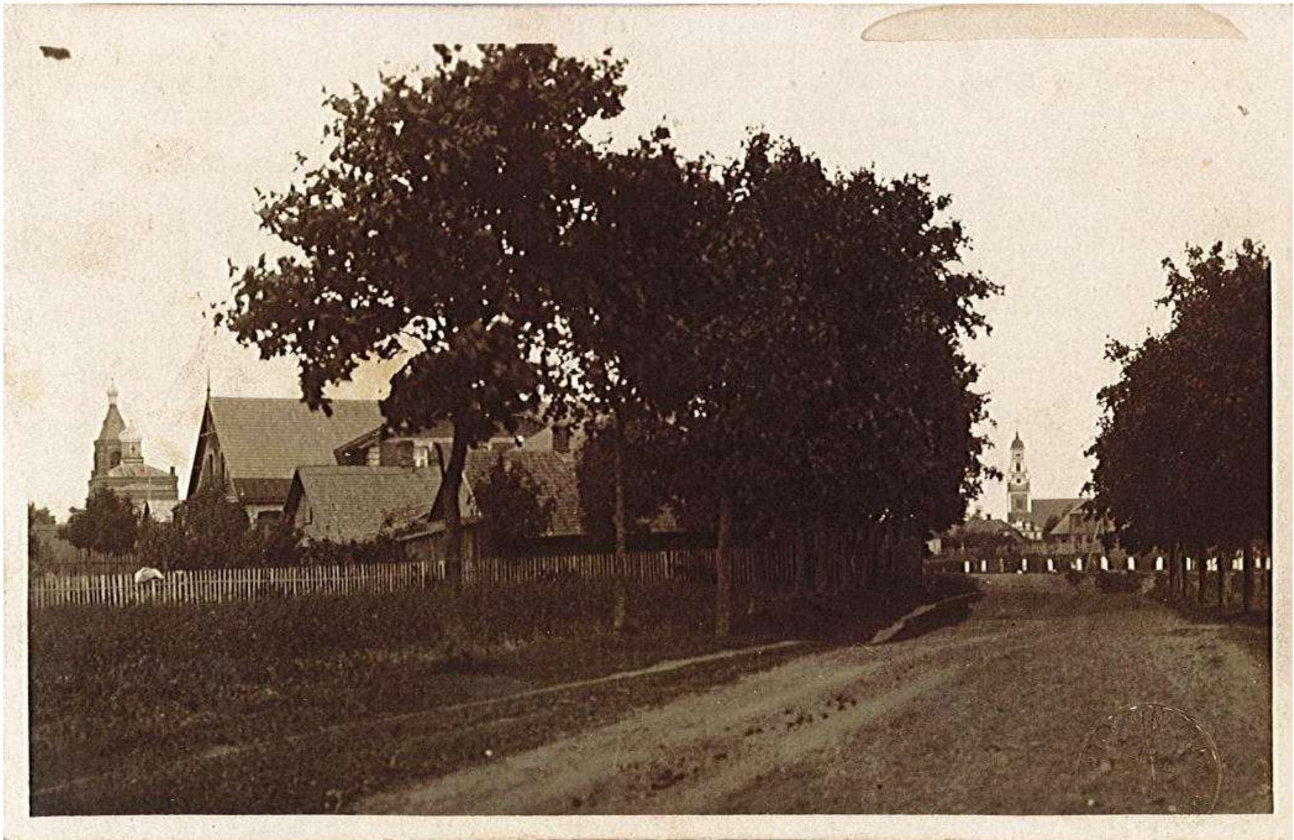
No Helēnas ielas redzama baznīca