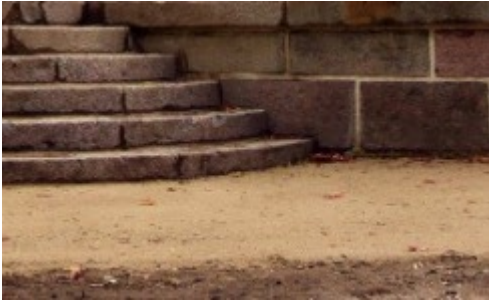
Fitinghofu dzimtas mauzolejs

Ēka restaurēta projektā “Gaismas ceļš cauri gadsimtiem”, tās atklāšana notika 2018. gada 5. oktobrī. *