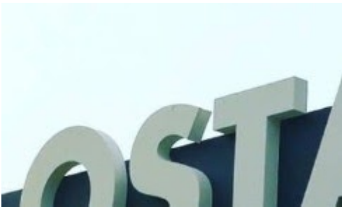
Elektro velosipēdu un braucamrīku noma (Velo osta)

Uzņēmums, kura nojumes fragments redzams attēlā, darbu uzsāk 2020. gada jūnijā. Kādu pakalpojumu piedāvā uzņēmums? *